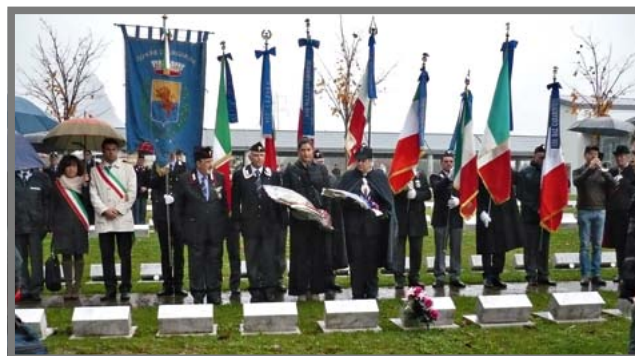
Longarone (BL), Cimitero Munumentale, 9 novembre 2013. Cerimonia di commemorazione davanti alle tombe dei tre militari dell'Arma periti nella “Tragedia del Vajont”, ricorrendo il 50° dell'evento. Sono presenti alcuni familiari e colleghi di corso del V.brig.