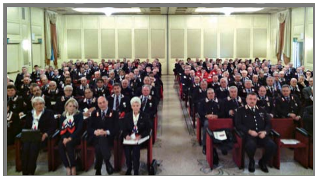
Pescantina (VR), 18ª Assemblée Generale ANC Veneto

Il 12 settembre 2013, il Gruppo delle Benemerite di Vicenza ha costituito il Gruppo Corale “Fedelissima”, il quale ha debuttato con successo alla cerimonia della Virgo Fidelis, il 21 novembre 2013, presso la Basilica di Monte Berico.